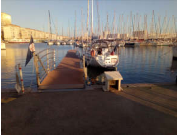
Figure 5 - Isida au quai d'honneur