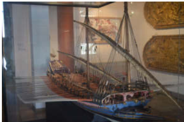
Figure 12 - Sans moteur, c'était la galère.