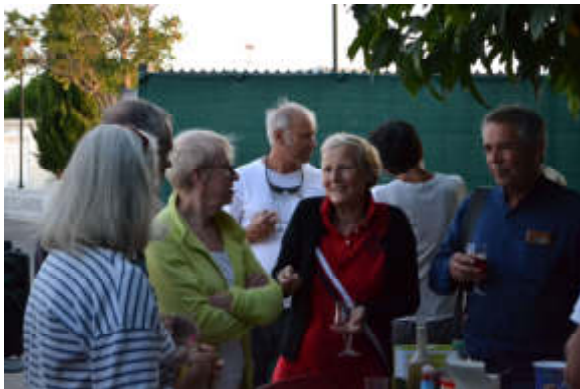
Figure 23 - Des membres du CNMT