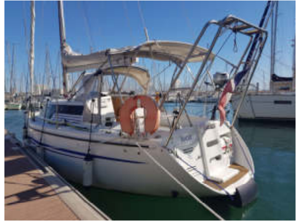
Figure 6 - Biloup 90 fini par le CNMT