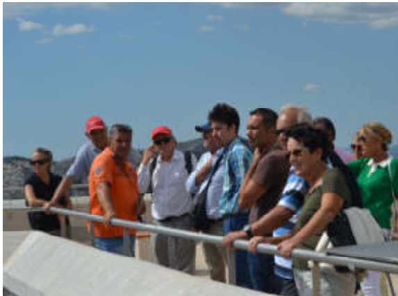
Figure 17 - Sur le toit du Mémorial du Débarquement.