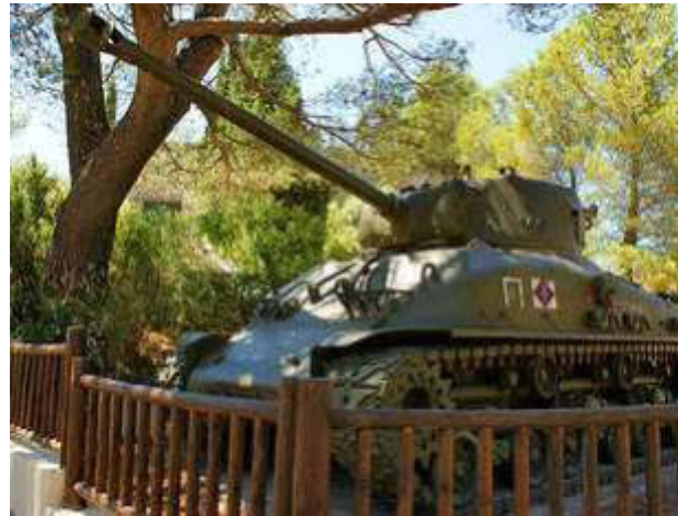
Figure 18 - Char

Mais, rassurez-vous, entre les deux musées, on s'est rassasié.