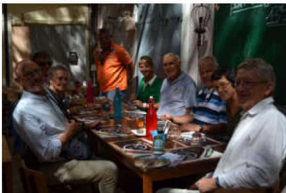
Figure 19 - Au Restaurant la Tête à Toto

Mais, rassurez-vous, entre les deux musées, on s'est rassasié.