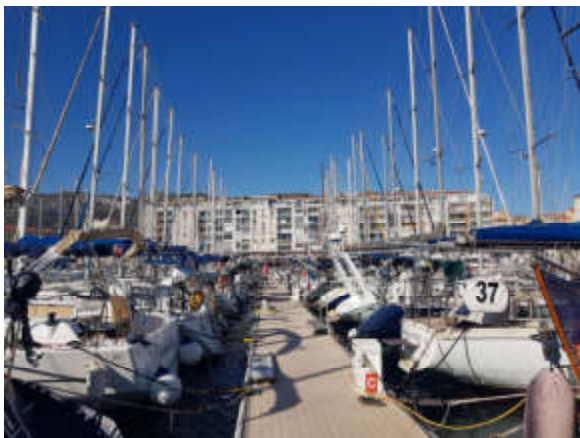
Figure 3 - Avant tout un Club de voiliers