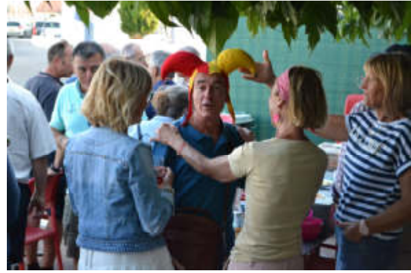
Figure 22 - Quel succès auprès de ces dames.