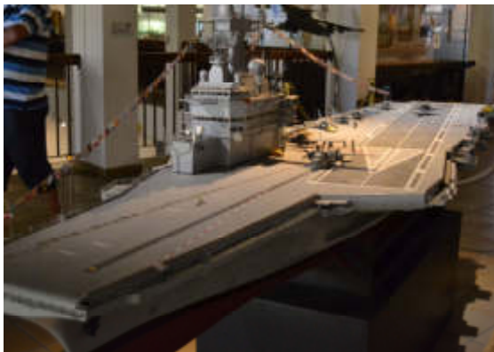
Figure 13 - Le Charles de Gaulle