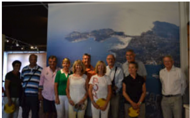
Figure 14 - Devant une photo de la rade de Toulon

L'après-midi, par le téléphérique du Mont Faron, nous nous sommes rendus au Mémorial du Débarquement et de la Libération. Du toit, la vue sur la mer est sublime.