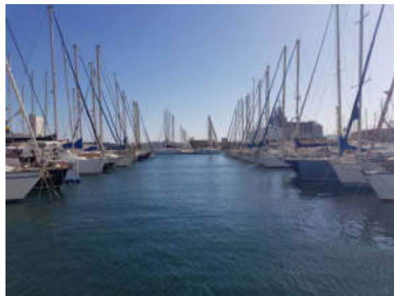
Figure 4 - Bien de l'espace pour les manœuvres.

Puis Hubert, nous a convié dans le Club House pour nous raconter la descente par mers, fleuves et canaux des deux Biloup 90, Isida et Hercule, de Mondeville à Toulon, fin 2017, début 2018, nom de code MEDFLUMAR.