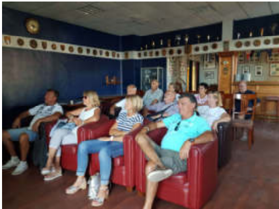
Figure 7 - L'auditoire.