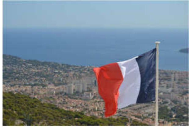
Figure 16 - Position stratégique du Mémorial.