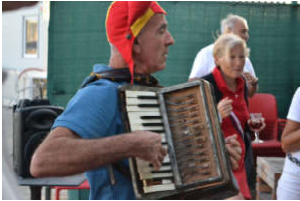
Figure 21 - Apéritif ponton en musique.